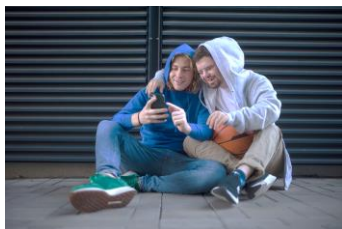
VI ENCUENTRO NACIONAL DE JÓVENES