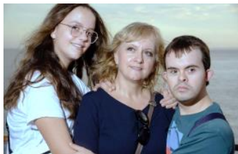
XXIV ENCUENTRO NACIONAL DE FAMILIAS